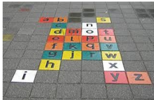
Pleinplakkers hinkelspel en alfabet spel