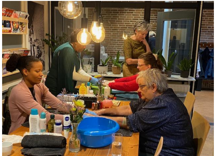
Mantelzorgdag georganiseerd voor mantelzorgers uit Bilgaard