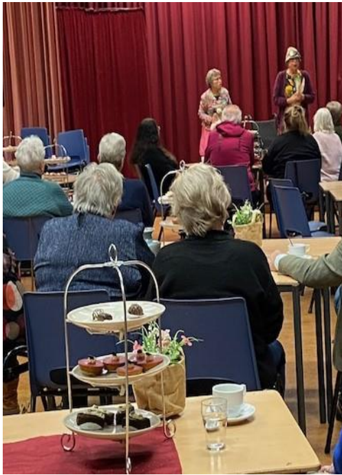
Deze werkgroep heeft In 2023 op 12 november een