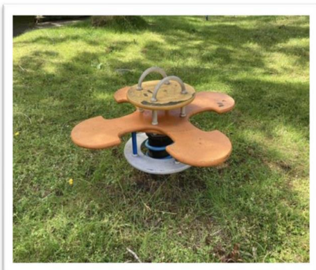
W21-04 de Fennen 31.