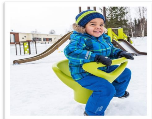
Nieuw de Froggie 220034