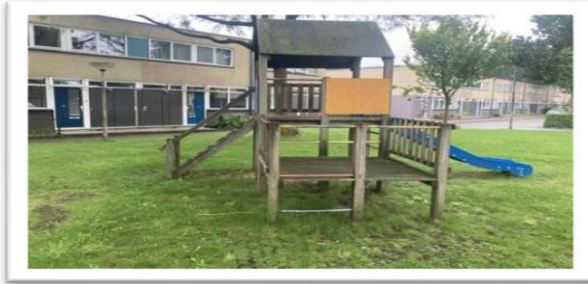
Oude speeltoestel De Hoodollen 518