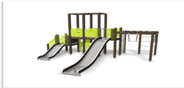
Vervangen Nieuwe Speeltoestel